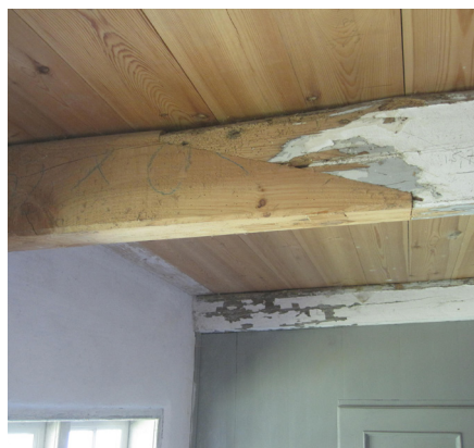
Bjælker repareret efter svampeangreb

almindelighed ikke anledning til reparationer. Hvis det er store revner, kan det være nødvendigt at udluse eller udspartle med tjærekit. Det er vigtigt, at lukningen er helt tæt, og at træet er tørt, når arbejdet udføres. Tjærekit fremstilles af trætjære, hvori man blander slemmet kridt, indtil man har en kitagtig konsistens.