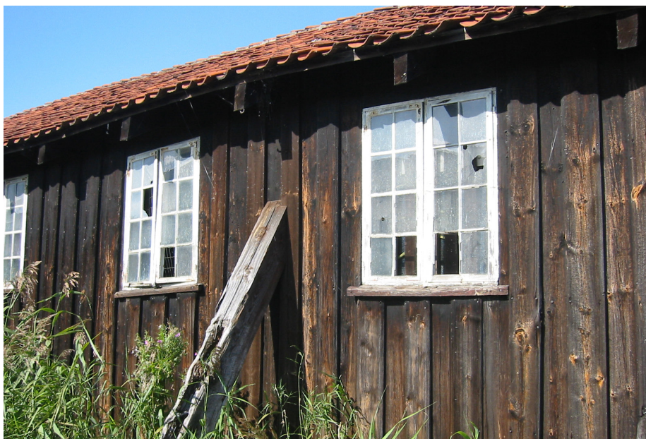
Råd- og svampeskader knytter sig primært til træ. Det betyder dog ikke at træbygninger ikke kan blive meget gamle, hvis træet er i god kvalitet, har en gennemtænkt konstruktion og vedligeholdes løbende. Her Kanonbådsskurene på Holmen i København – der er for dettes vedkommende er næsten originalt, har stået i over 200 år og nu i den grad mangler vedligeholdelse.

Betingelserne for et svampeangreb i en bygnings trædele er ilt, vand og varme. Hvis træfugtigheden f.eks. er på 20 %, er der stor risiko for svampeangreb. Svampe er sporeplanter, hvor formeringen sker ved mikroskopiske sporer i modsætning til andre planters frøformering. Svampearterne mangler