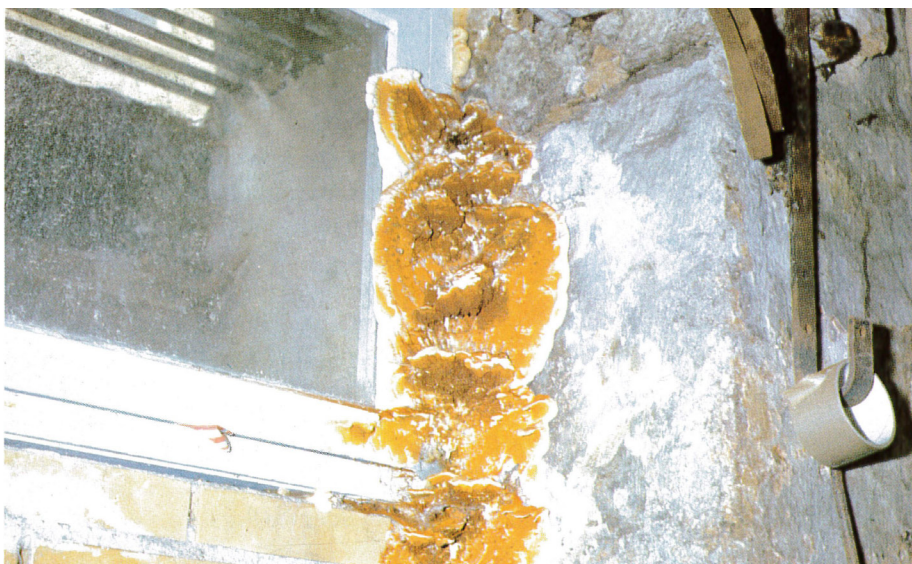
Frugtlegeme af ægte hussvamp efter indtrængen af vand gennem vindue

meget nedbrudt under f.eks. cementpuds eller lag af stenkulstjære; begge dele skal undgås som overfladebehandling på træværk, da de er for tætte og holder på fugtighed. Omvendt kan et tilsyneladende stærkt skadet stykke tømmer vise sig kun at have en ganske overfladisk nedbrydning. Vurder nøje, hvor svækkede de angrebne tømmerdele er, og i hvilken grad de indgår som en bærende del af bygningen. Især fodremme og nederste zone på stolper