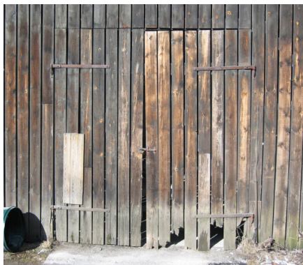
Svamp og råd er i princippet det samme. Begge nedbrydningsformer er angreb af en eller flere svampearter. Når man i praksis skelner mellem svamp og råd, skyldes det et forsikringsteknisk forhold, hvor svamp er det pludselige, hurtigt udviklede angreb, mens råd er betegnelsen for et angreb med en langsom udvikling, der kan strække sig over 10-15 år eller mere.

de grønkorn, som er øvrige planter grundlag for celleopbygning. Svampene lever på det døde træs indhold af cellulose og lignin – to væsentlige bestanddele af træ.