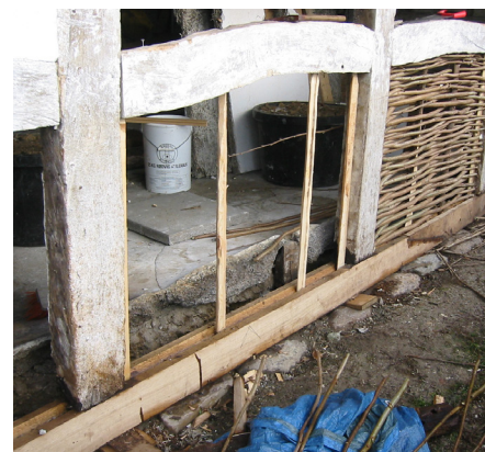
Fodremmen er typisk det der rådner først på en bindingsværkskonstruktion. Er man heldig, er stolpeenderne intakte, som her.

Det er nødvendigt at åbne og eventuelt adskille konstruktionen for at få overblik over skadens omfang. Forudsat at bæreevnen er i orden, kan man – bortset fra angreb af ægte hussvamp – lade svampeskadet træ forblive i bygningen. De skadede dele behandles med et anerkendt svampedræbende middel, og samtidig med, at skaden udbedres, skal man sørge for, at fugtkilden fjernes, og at trækonstruktionen i fremtiden holdes tør og vel ventileret. Hvis tømmer eller trædele er stærkt svækkede, må man forstærke eller udskifte delene.