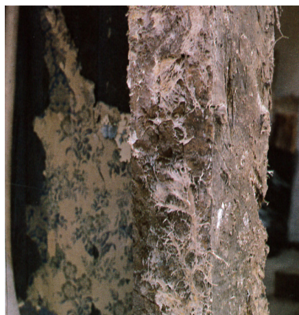
Ægte hussvamp er meget farlig for alt træ, da den er stærkt nedbrydende og bl.a. selv kan fugte træet op, så nedbrydningen går endnu hurtigere.

Træ under nedbrydning af svampe vil svækkes. Der fremkommer skrumper, evner og sprækkeklodser på langs og