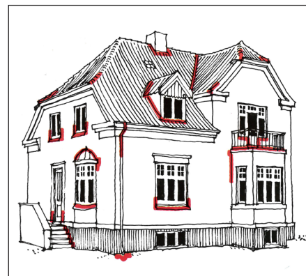
Svage punkter, som kan være årsag til svampeangreb.

bistand – ikke for at floraen kan få en benævnelse på latin, men det er vigtigt at få fastslået, om der er tale om ægte hussvamp eller en af de andre svampearter. Er der tale om angreb af den ægte hussvamp, må man ikke vælge eller lade sig vildlede til risikable kompromisløsninger. Både træ og omgivende murværk skal undersøges. Fugtkilden kan være utætte vand- eller afløbsrør eller kondensdannelser, mangelfuldt eller dårligt ventilerede kælderrum, loftsrum o.l., utætte skotrender, inddækninger, tilstoppede tagrender og nedløbsrør. Især i køkken og baderum er der ofte problemer i ældre huse. Fugtkilden skal fjernes.