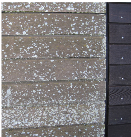
Algevækst (gråfarve-svampe) på overfladen af en træbeklædning er forholdsvis uskadelig for træet, men er et tegn på, at miljøet er for vådt.

stede, vil svampen dø ud. Visse arter kan dog gå i tørkedvale i nogle år.