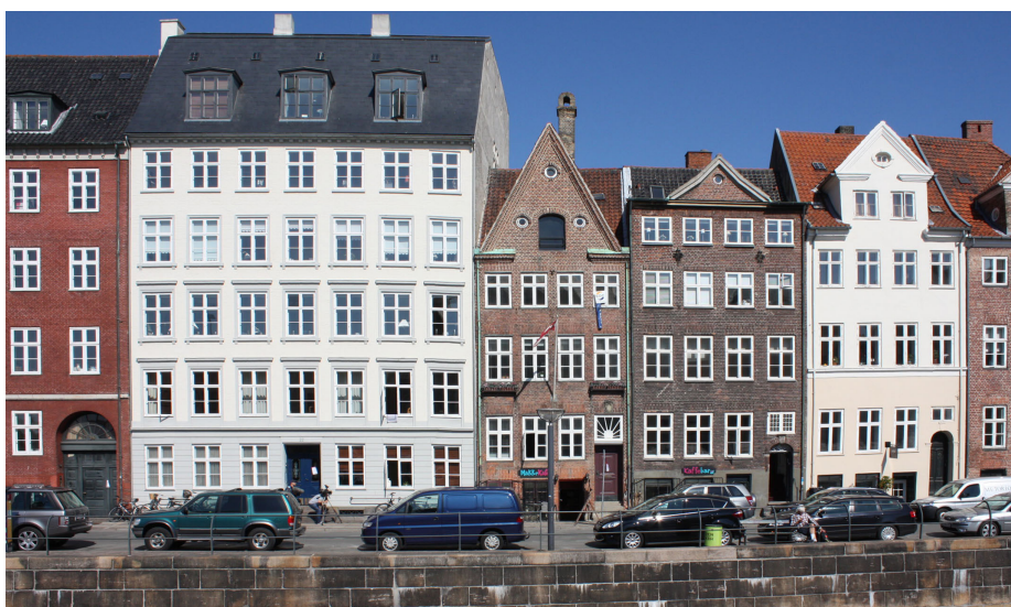
Fredet og bevaringsværdigt bygningsmiljø i København præget af smukt murværk eller puds, rige facade-dekorationer, gesimser, vandrette bånd, vinduesindfatninger og fordakninger m.m. En udvendig facadeisolerings vil forringe husenes arkitektoniske kvaliteter. Men læg mærke til, hvor meget selve vinduerne fylder på facaderne, og hvor lidt facadeareal, der er tilbage, hvis vinduerne og vinduesbrystningerne (det vandrette stykke under vinduerne) energiforbedres indefra. Dette kræver ikke at de gamle, originale vinduer skiftes – tvært imod.

Dette informationsblad indeholder en række principper for, hvad man som