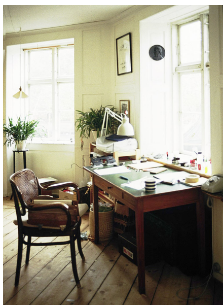
Hus fra 1820-erne på Christianshavn. De tykke mure er indvendigt beklædt med såkaldte 'pillepaneler', d.v.s. træpaneler i vindueslysninger og på ydervægsfladerne. De er smukke, men de giver også ekstra isolering af ydermuren. Dette er her suppleret med isolering af brystningen under vinduet, indvendige forsatsruder, i form af hele ruder af hærdet glas, der er næsten usynlige, men som skal tages ned om sommeren.

Beregninger har vist, at det i det store miljøregnskab bedre kan betale sig