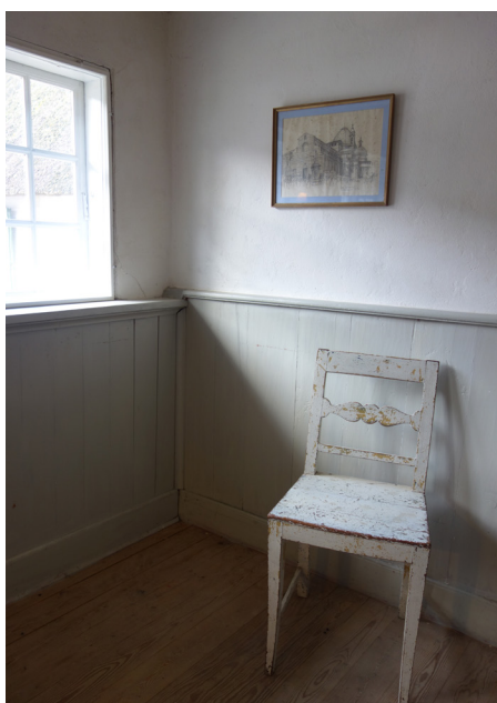
Et interiør som dette med pudsede vægge, der er limfarvede, med limfarvede trælofter og sæbeskurede gulve samt linoliemalet træværk har gode fugtmæssige egenskaber, da overskydende fugt ikke kondenserer (bliver til vand) på overfladerne og risikerer at danne skimmelvækst. I stedet opsuges fugten af de porøse materialer.

bedst muligt, men for både fredede og bevaringsværdige bygninger må dette ske med hensyntagen til bygningens bærende bevaringsværdier.