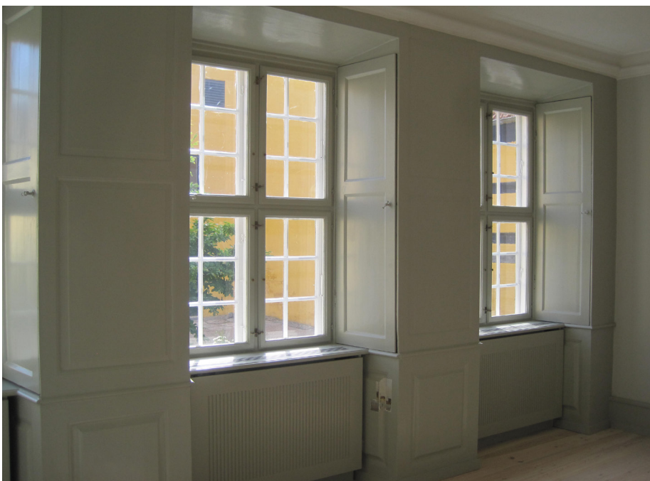
Rent bort set fra de arkitektoniske og bevaringsmæssige omkostninger, vil de økonomiske omkostninger ved at etablere en indvendig efterisolering af denne ydervæg, incl. flytning af paneler, loftsstuk m.v., være så store, at arbejderne ikke vil være rentable. Ikke mindst set i forhold til den ret lille isoleringsmæssige effekt, der kan opnås.

Det betyder ikke, at man som ejer ikke skal energiforbedre bygningen mest og