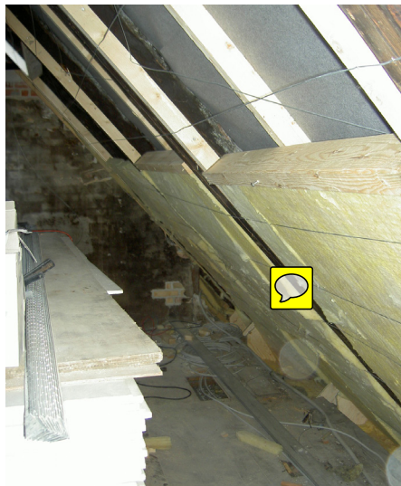
Efterisolering af et tagrum mellem spærene. Der opsættes en diffusionsåbent, selvbærende undertag oven på spærene med lægter og tagsten over. Herunder isoleres der med mineraluld, men andre isoleringsmaterialer i batts kan også bruges, f.eks. hør, cellulosefibre, papir. Det er vigtigt, at der etableres et fastholdt, ventileret hulrum på 3-5 cm (billedet t.h.) mellem isolering og undertag. Her sidder der ståltråde, der forhindrer isoleringen i at lukke hulrummet.

I en ældre bolig vil utætheder, beboernes åbning af døre m.m. normalt give godt halvdelen af det ønskede luftskifte, men resten må skaffes ved at åbne vinduer og friskluftventiler samt evt. ved mekanisk ventilation. Ventilation tæt ved fugtkilden vil naturligvis være det mest effektive.