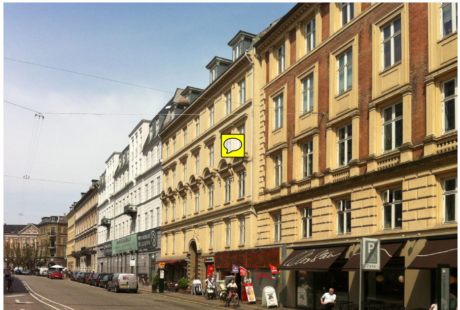
Udvendig facadeisolering er rent teknisk en god løsning for murede huse, men hvis der forekommer facadedekorationer og kraftigt relief i facadearkitekturen, der er så typisk for ældre bygninger, eksempelvis fra historicismen som her, er dette umuligt. Man kan så i stedet isolere tagrummet, mod terrænen og sætte forsatsvinduer på vinduerne. Hvis brystningerne under vinduerne er meget tynde og kun i én stens murværk, kan man også efterisolere indvendigt her.

Dette gamle princip for naturlig ventilation går ud på, at den friske luft tilføres opholdsrummene gennem naturlige utætheder i huset. Halvkolde rum som sovekamre, forstue, bryggers eller spi-