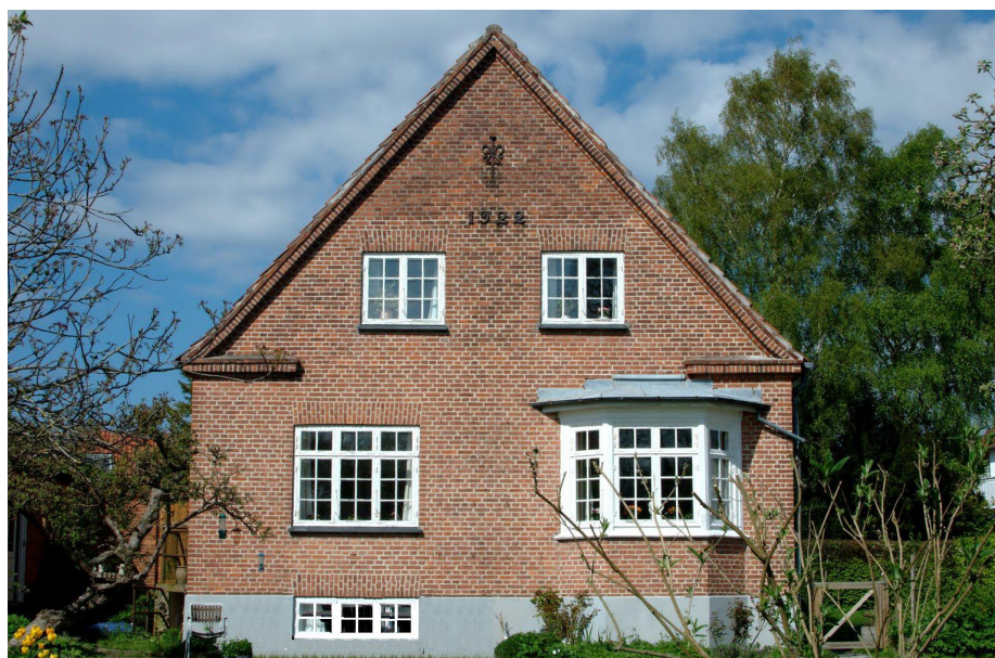
Pæn og harmonisk Bedre-Byggeskik villa fra 1922. Det er oplagt at energiforbedre dette hus ved at hulmursisolere ydervæggene, sætte forsatsvinduer op på de eksisterende vinduer samt isolere taget indefra med 15 cm isolering. Hvis taget isoleres uden på spærerne, løfter man tagfladen, så den markante gavk kommer ud af proportion.