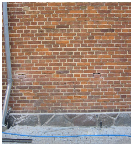
Ved hulmursisolering fræser man mursten ud på strategiske steder, så hulmuren kan blive fyldt med et isoleringsmateriale – granulat eller luftfyldte kugler. Dette blæses ind, hvorefter hullerne lukkes med de samme mursten. Man kan evt. efter dette udtage andre sten, for at kontrollere, at hulmuren er fyldt op, som den skal.

I enfamiliehuse kan aftrækskanaler, der er ført over tag, fra køkken, bad og eventuelt soverum ofte fjerne tilstrækkeligt med luft ved naturligt aftræk.