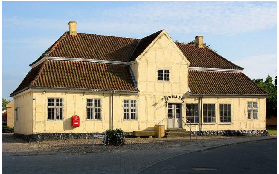
Når man finder butikker indrettet i 1700-tals bygninger, som her i Willer's Gärd i Rødby, opført i 1729, er selve butiksfacaden og -indretningen, først sket efter accisens ophævelse i 1852- hvilket bl.a. også ses ved at forretningsvinduerne er af støbejern, der først blev almindeligt omkring 1840-50.

I købstaden boede der forskellige handelsmænd, håndværkere, skippere, søfolk og andre (præster, skolelærere, læger m.fl.), der samlet blev kaldt borgere. Men selv om f.eks. håndværkerne producerede varer for at sælge dem til byens andre borgere eller de tilrejsende bønder eller søfolk, skulle al handel foregå på Torvet, og måtte ikke finde