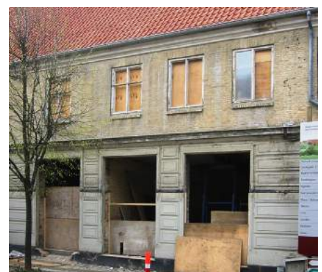
Endnu et eksempel på før og efter. Forretningsejendommen Spielweg & Co i Christiansfeld. Inde bag den voldsomme forretningsfacade, der helt skar huset helt over vandret, fandt man spor efter en tidligere, faktisk ret smuk, harmonisk og flot håndværksmæssig detaljeret forretningsfront. Denne stammer formentlig fra en større ombygning og udbygning af huset i 1856.

Huset er i øvrigt interessant i forhold til butikernes kulturhistorie i Danmark. Det er opført i 1778 og fra starten indrettet til 'handelshus', hvilket skyldes Christiansfeld's særlige købstadsmæssige status, der muliggjorde handel udenfor torvepladsen. Den viste forretningsfacade er næppe fra 1778, men fra 1856, idet vinduesoverkanterne er båret af indmurede jernprofiler.