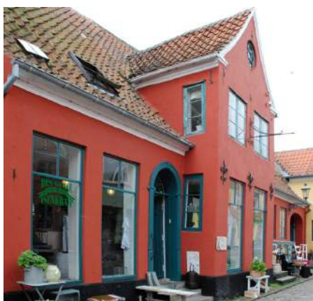
Ud over at passe ind i gadens farvemæssige helhed, kan butikkens og facadens farvevalg også samtidigt afspejle forretningens identitet – her en knaldrød (engelskrød) isenkræmmerbutik, der gerne må være lidt festlig, og en mere alvorlig og kølig grå ejendomshandel.

byggetekniske problemer. I mange tilfælde passer den nye dragt slet ikke til huset, der enten kan gøre facaden for glat og slikket eller for rustik.