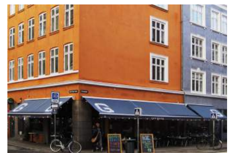
København kan nu også. Smuk overensstemmelse mellem markiser og husfacadernes lyse kalkfarver – både tilpasset og som kontrast. Enkel og afdæmpet skiltning. De kulørte lamper er kun opsat i anledning af julen.

I mange af de historiske bykerner nedlægges der i disse år den ene gamle butik efter den anden. Det er oplagt at indrette eller 'genindrette' disse til almindelig beboelse igen. Her har man 3 forskellige muligheder.