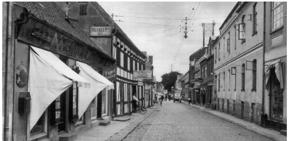
Foto fra midten af 1920'erne i Adelgade i Nysted. De solafskærmende markiser, der skulle modvirke solblegningen af bøgerne i Nystred Boghandel, var ikke så standardiserede som i dag, men dog alligevel mulige at klappe ud og ind, som på modsatte side af gaden, efter behov.

Der findes i dag et væld af forskellige permanente og mobile markiser. En stor del af dem er udført i materialer, der er fremmede for gamle huse - f.eks. blank plastik- eller nylon-dug. Ydermere er farverne ofte skrigende i forhold til traditionelle facadefarver, og markiserne kan have faconer med tunger, frynser eller lignende.