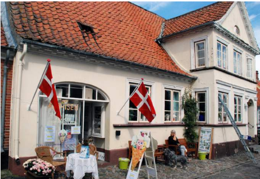
Ganske enkel og uprætentiøs iskiosk og kioskfacade – indrettet i en køreport. Helheden er stort set uberørt af indgrebet i huset og designet er både moderne og traditionelt på samme tid.

Hovedindtrykket af butiksfacaden bør være i harmoni med den øvrige del af bygningen, også hvad angår overfladebehandlinger og farver. Er huset født med en særlig fremhævnning af underfacaden i form af for eksempel behuggede granitsten, kvaderpuds eller andre særlige pudsstrukturer, skal man udnytte sådanne træk i sin butiksfacades udseende snarere end at skjule dem. Forretningens eget særpræg kan skabes med detaljer som skiltning, belysning, vinduesudstilling og evt. markiser - ting, der underordner sig arkitekturen.