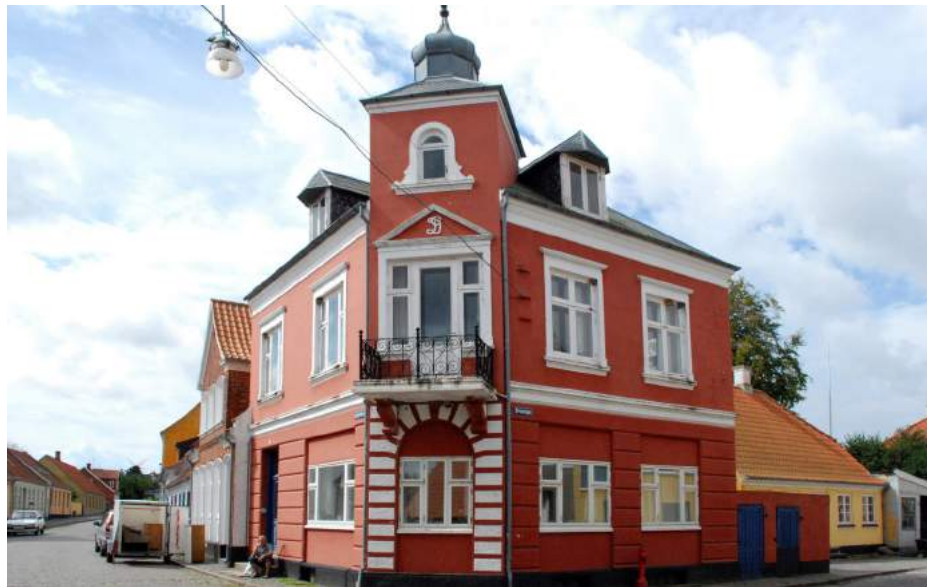
Øverst: Denne forretningsejendom i Årskøbing med hjørnetårn, spir, kvaderpuds, tre kæmpemæssige forretningsvinduer samt balkon og trekantgavl, har i sine velmagtsdage nærmest været en københavnsk støgbutik værdig. Facaden bygger i den grad op til og fremhæver forretningens vigtigste element, indgangsdør i hjørnefaget. Ingen skulle i hvert fald gå og lede efter den, så det er lidt synd, at der er sat et vindue i her. Men det har nok ikke været alt for smart med en stor glasdør ind til en stue her.