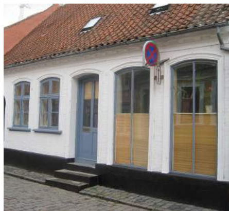
T.v.: Nedlagt butik er blevet til beboelse. Man er nok ikke i tvivl om at der ikke sælges noget i butikken mere. De fleksible persienner kan rulleres op og ned, så vinduesbrystningen kan blive højere eller lavere end de øvrige vinduer i facaden.