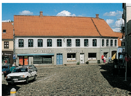
På Torvet i Mariager har denne forretningsejendom for nogle år siden fået facaden kraftigt forskønnet. Selv med en mere stilfærdig skiltning og mindre vindueshuller sælger bagerforretningen næppe færre franskbrød i dag end før denne ombygning.

har også været, at den enkelte forretning skulle skille sig så kraftigt ud fra mængden som muligt.