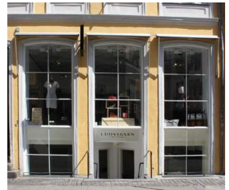
De elegante, præcise og tynde jernsprosser klæder denne butiksfacade virkelig fint – og virker langt mere raffineret end hele ruder. Det er derfor perfekt, at ruderne kan isoleres meget effektivt indefra med hele energitermoruder, uden sprosser, samtidigt med at det fine arkitektoniske udtryk bevares fuldt ud. Bemærk også de meget diskrete markiser i opklappet form.

Butiksdøre bør ikke udføres med udvendige beklædninger af for eksempel panelbrædder, aluminiumsplader