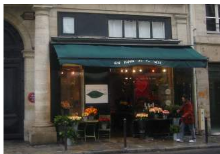
Her passer den meget enkle og beskedne markise både til de øvrige farver i husets underfacade, bl.a. porten og nabobutikken, og så passer den endvidere farvemæssigt til butikkens navn og indhold, 'au nom de la rose'. Vi er med andre ord i Paris hos en filmglad butiksejer. Skiltningen er også ganske diskret og pæn, anbragt på kanten af markisen.

Snarere end at vælge den slags bør man holde fast ved den enkelthed i formen, der kendetegnede de oprindelige markiser. Det vil klæde den bevaringsværdige facade bedst.