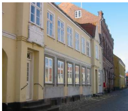
Nogle vil kalde det 'historieforsknings' at tilbageføre en senere indrettet butiksfacade i et ældre hus til det oprindelige udseende. Men hvis rekonstruktionen bygger på sikre kilder og bibringer facaden sin tidligere harmoni, er dette et lige så 'ægte' bygningshistorisk indgreb - som at lade butiksvinduerne stå eller give facaden et helt nyt og moderne arkitektonisk udtryk.