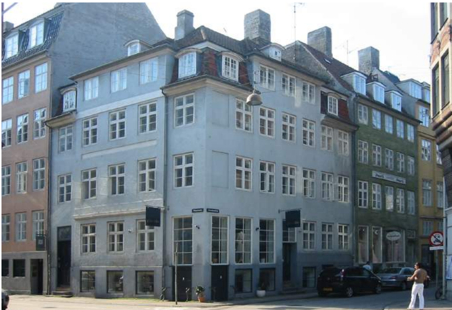
Her er forretningsvinduerne gjort større end de øvrige vinduer, for at signalere, at der findes en butik på stedet, og trods den høje placering, kan de forbigående sagtens beskue et passende vareudvalg. Vinduerne følger derudover facadetakten og de øvrige vinduers overkant. Skiltningen klares via udhængsskilte. Alt i alt en pæn og harmonisk løsning, der ikke skæmmer huset eller gaden.

denne udvidelse ske i overensstemmelse med facadens fagdeling, altså ved sammenlægning af to fag til ét fag i butiksfacaden. Sammenlægning af mere end to fag vil som regel være ødelæggende for facadens harmoni.