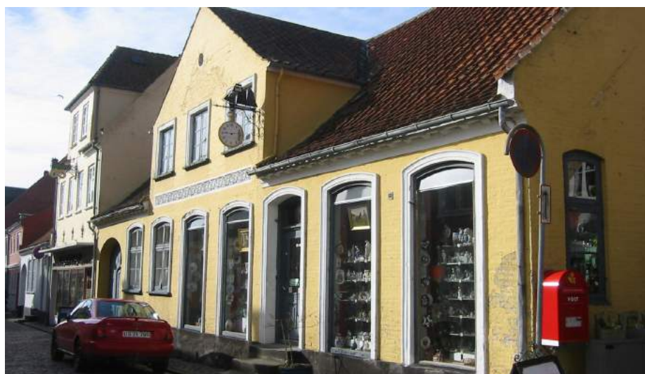
En ellers pæn og nydelig forretningsfacade – men den afskallede plasticmaling harmonerer ikke med den fine gamle ejendoms arkitektoniske udtryk. En lysende gul kalkning ville passe bedre.

Ved rekonstruktioner af ødelagte butiksfacader og især -vinduer er det ikke altid sagen at få småsprossede forretningsvinduer igen. I mange tilfælde er en enkelt, uopdelt glasflade at foretrække frem for påhit, der ikke har baggrund i husets oprindelige arkitektur.