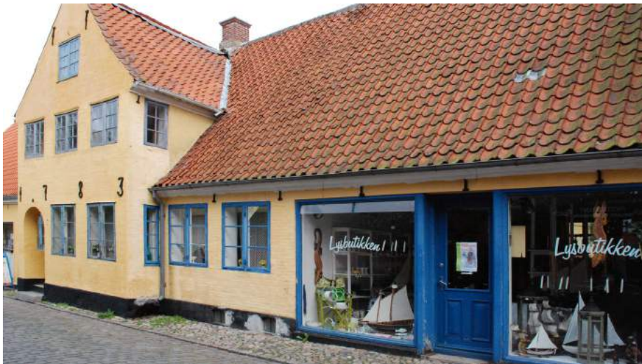
En kalkning er totalt mat, hvilket får sollyset – og lyset i det hele taget, til at spille smukt i overfladens kalkkrystaller, så facaden herved fremstår meget klar og elegant med en lysende glans.

Et par tommelfingerregler for, hvad der indgår i gode løsninger, er: