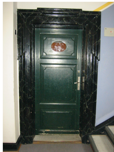
Dør fra Christians Havns Gymnasium fremstillet ca. 1910 malet med linolielakfarver, linoliemaling iblandet lak og standolie for at gøre den blank. Påført i tynde lag med slibning afvekslende med helt fine slibemidler.

Det første kaldte man lak eller fernes, det andet for lakfarver eller olielakfarver. Da "fernes" i dag også er navnet på en kogt linolie, uden harpiks, vil vi om de harpiksholdige produkter bruge benævnelserne: lak og olielakfarve. Som dette "blankende" stof brugte man allerede i middelalderen plantesaften/harpiksen (kolofonium- eller balsamlak) fra fyrretræer, i 1700-tallet og senere suppleret mere eksotiske træarter som pistachetræet (mastiks), cypres (sandarak) eller forskellige ostindiske træarter (dammar). En