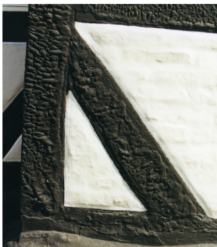
Stenkulstjæret bindingsværk – med en meget 'nopret' overflade, der bliver blød og løber i stærk solvarme.

ikke nødvendigt at fortynde den. Man kan f.eks. fortynde 1 liter trætjære med 1 liter rå linolie. Er blandingen for tyktflydende, hvilket som nævnt afhænger af vejret og temperaturen, kan man yderligere iblande et fortyndingsmiddel, sprit, terpentint, petroleum eller sågar klar "træbeskyttelse". Denne blanding tilsættes en passende mængde "farvepasta", fremstillet ud fra en smule trætjære eller linolie rørt godt op med pigmentet. Farvepastaen må gerne stå i blød natten over, før den røres i trætjæren. Der skal også røres jævnlige i malingen under arbejdet, da pigmenterne ellers bundfælder sig.