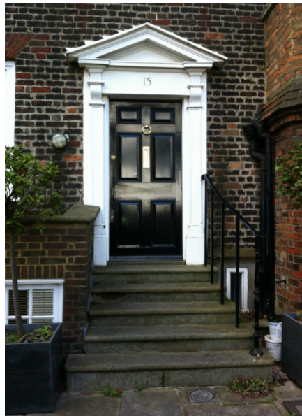
Denne dør fra 1820-erne i London er formentlig i dag malet med den blanke alkyd-maling – idet denne malingstype er stadig tilladt i England.

I 1920'erne udviklede den petrokemiske industri i USA den første kunstigt