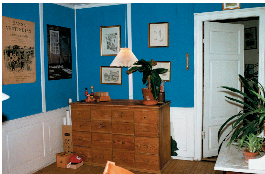
Limfarver har deres store fordel derved at de præsenterer pigmenterne meget smukt og lysende, hvad der især ser godt ud sammen med hvide indramninger som her. Dernæst er limfarver ret nemme at arbejde med, og de passer godt til ældre interiører.

Der tilsættes i dag ofte svampehæmmende midler til maling, herunder linoliemaling og andre linolieprodukter til udendørs brug. Disse malinger og olieprodukter må ikke anvendes indendørs.