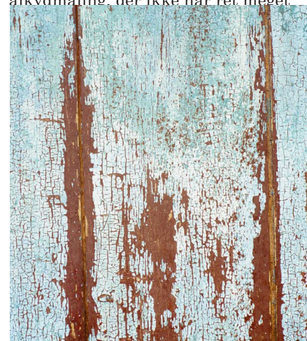
Typisk meget gammel linoliemalet overflade, hvor de regnskyllede flader blegner en smule og de skyggebeliggende områder mørkner. Derudover krakelerer malingen efter mange år som et slangeskind.

Det er vigtigt at anvende fagtermen linoliemaling om linoliemaling og ikke malerfagets gamle betegnelse oliema- ling eller hybriden "gammeldags oliema- ling". For det første eksisterer der en del forvirring, ikke mindst indenfor malerfaget selv, om hvad "oliemaling" er. Bare for få år siden var "oliema- ling" nemlig den gængse betegnelse for alkylmaling, der ikke har ret meget