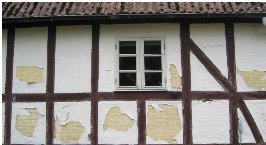
Meget typisk plastikmaling, der efter relativt få år begynder at skalle af på en meget grim måde.

I slutningen af 1800-tallet opstod der som et biprodukt fra gasværkerne et