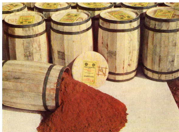
I Falu rödfärg, eller på dansk Svensk slamfarve, indgår det såkaldte ’rödfärgspigment’, der er et biprodukt i form af et jernoxid til kobberproduktionen i byen Falun i Sverige. Opskriften på ’Falu rödfärg’, der er oplyst på selve etiketten, stammer helt fra 1700-tallet.

”Forstærkning” af kalken med kasein benyttes derfor ofte ved kraftige farver (røde, blå, grønne eller sorte), bl.a. på ”opstreget/opstolpet” bindingsværkstømmer. Man skal dog være opmærk-