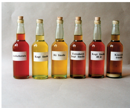
Linolie produceres i fem variationer, fra venstre linoliefernis (kogt linolie, hvor der under kogningen er indblæst ilt) kogt linolie, rå linolie (koldpresset), ekstraheret (varmpresset) kogt linolie og kogt linolie, lagret i 40 år. Den sidste anvendes mest til kunstmaling, da den er ret tyktflydende og tørrer/hærder meget hurtigt. Yderst til højre Kinesisk træolie, der mest anvendes til lakering.