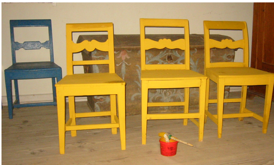
Tre træstole malet med en 'hjemmelavet' kaseintempera. Farven har en smuk 'limfarveagtig', lysende lod og så er den lidt mere slidstærk end limfarve.

som udendørs, og som er fremstillet af en blanding i rette forhold af en vandig lim (-emulsion) og rå eller kogt linolie samt en vis mængde pigment (tørfarve-pulver). I praksis blander man en passende mængde linolie i en almindelig limfarve, hvorved denne forstærkes.