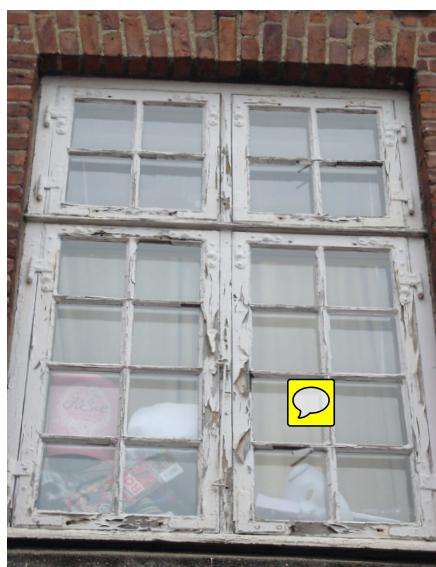
Meget slemt afskallet plast- eller akrylmalet vindue, kan også være vandig alkyd eller plastalkyd, der stort set er det samme.

Plastdispersioner tørrer ved vandets fordampning og plastpartiklernes sammenklæbning til en uopløselig og elastisk film. For de sædvanlige plast-