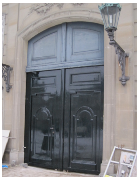
Linoliemalet port har fået 'en gang lak' på de to portfløje for at gøre disse blanke. Så her kan man sammenligne den 'almindelige' linoliemalings matte og blegede overflade og lakfarvernes blanke ditto.

Cementpulvermalingen hærdner betydeligt hurtigere end kalk, og er derfor langt mere følsom over for fugt- og temperaturforholdene under hærdningen. Man skal derfor færdiggøre en hel facade, eller et omkranset område på