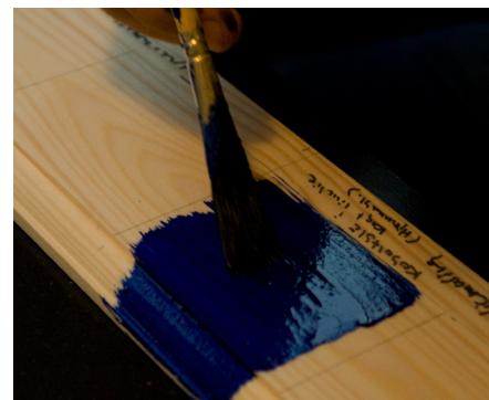
Ved maling med limfarver er det meget vigtigt at man udfører et prøveopstrøg på en vis størrelse og lader dette tørre helt op. Herefter vurderer man farvens dækning, dens lod og om den færdige maling smitter af eller lignende. Smitter farven af skal der mere lim i, hvilket igen vurderes efter et nyt prøveopstrøg. Således fortsættes indtil malingen og farven er perfekt.

Limfarvernes mest attraktive egenskab er deres smukke lysreflektion, som skyldes at pigmenterne ligger