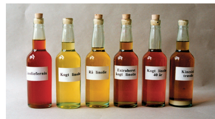
Forskellige planteolier til maling, olieimpregnering og lak. fra venstre: Linoliefernis (Kogt linolie, iltet og tilsat fungicid). Kogt linolie (ikke iltet). Rå linolie (Koldpresset). Kogt Linolie (extraheret). Kogt linolie (lagret i 40 år). Kinesisk træolie..

Som navnet siger, kan forskellige vegetabiliske olier, primært linolie, benyttes til at hæmme udendørs træs vandoptagelse ved at poremætte veddet med olie. Det er en myte, at olierne trænger dybere ind i veddet, hvis de fortyndes med organiske opløsningsmidler, f.eks. terpentin. Terpentinen trænger godt ind i træet, men trækker ikke olien med i nævneværdig grad. Man kan f.eks. stikke et stykke trækpapir lodret ned i en stærkt opløst linolie og se, hvordan de to væsker deler sig.