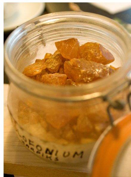
Kolofonium, harpiks i rensat og fast form, er krystallinsk og ugennemsigtigt. Men hvis kolofonium varmes langsomt op og køles langsomt af, bliver det amorft – ukrySTALLinsk – og helt klart og blankt. Kolofonium-lakken kan gøres flydende i afkølet tilstand med terpentin, sprit eller linolie.

ler af i store flager eller bliver meget skjoldet, hvis træet bliver vådt, eller man risikerer at træet rådner under en tyk og tæt lak.