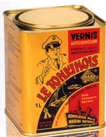
Tungolielak sælges under navnet 'Tonkinlak', le Tonkinois på fransk, hvorfra produktet importeres. Det er godkendt til den franske marine til rustbeskyttelse af jernskibe.

De rødlige "skæl/flager" fra de indiske lakskjoldlus, der lever af saften fra laktræer lader sig umiddelbart opløse i sprit, men ikke i terpentin, hvorved der fås en spritlak med en karakteristisk smuk rødlig farve. Denne schellak, der er meget tæt, anvendes