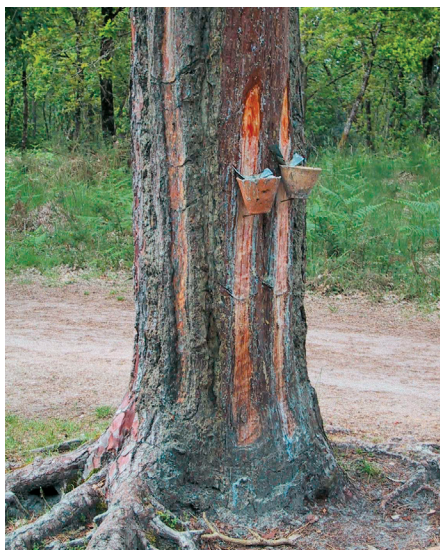
'Aftapning' af flydende harpiks på fyrretræer i Sydfrankrig. Efter at der er blevet ridset voldsomt i barken, løber harpiksen ud i små lerkar, der er anbragt med en lille tragt ind i træet. Harpiksen renses og krystalliserer til kolofonium.

uden en nærmere præcisering må man gætte sig til eller spørge, om de mener en syntetisk oliemaling/alkyd-maling, der er forbudt, eller linolie-maling. De to ting kan rent teknisk, kemisk og arbejdsmiljømæssigt slet ikke sammenlignes.