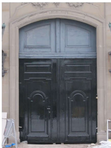
Denne linoliemalede port har fået 'en gang lak', eller nærmere 5-6, og er derved blevet blank, den oprindelige farve er kommet frem igen, og så er den også lettere at holde ren og pæn med den blanke, glatte overflade.

Lak er en klar væske, der i hærdet form giver en blank overflade, primært på træ. Lak anvendes fortrinsvis til indvendig brug, idet de fleste lakker er meget damptætte og derfor enten skal-