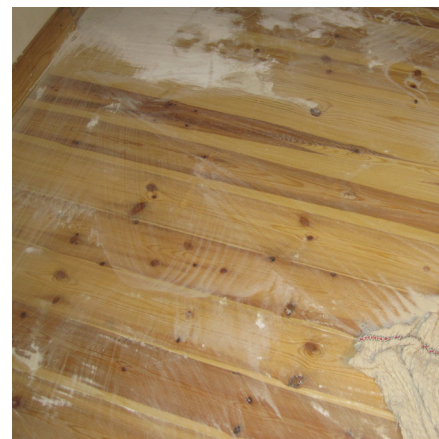
Behandling af trægulve med sæbespån er også en både beskyttende og bevarende behandling. Se informationsbladet Overfladebehandling af gulve

Den tynde bejdsning dækker imidlertid ikke tilstrækkeligt for sollysets nedbrydning af træet, og svampemidlerne er ikke virksomme i særlig lang tid. Dertil kommer, at terpentin- og petroleum-behandlingen rent faktisk opløser og udtrækker træets egne vitale olie- og harpiksstoffer, og derved udpiner og svækker veddet. Resultatet er fremkomsten af kritiske soltørningsrevner i træoverfladerne, hvorfra vand kan trænge ind i de 'ubeskyttede' dele af veddet og starte et råd- eller svampeangreb her. De dækkende, 'vandige træbeskyttelsesprodukter' er i praksis det samme som plast- eller akrylmaling og