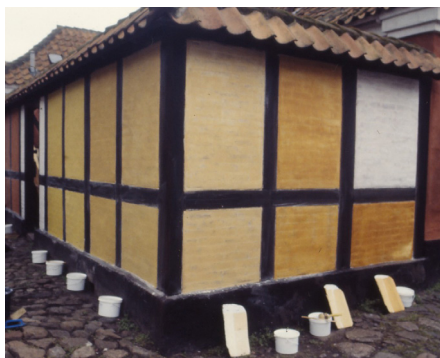
Kalkning i forskellige farver, guldokker, jernvitriolkalk, hvidtekalk m.m.

findes der akryllak, polyurethanlak, celluloselak, polyethylenlak m.fl.