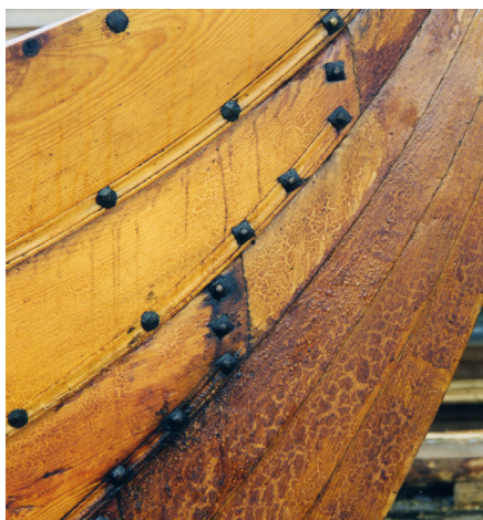
Træbjæret vikingeskibsstævn. Den upigmenterede træbjære er ikke særlig holdbar over for vejr og vind, slet ikke på et skib, så behandlingen skal gentages hvert år.

Træbjæren er imidlertid pga. sin ofte lavteknologiske fremstillingsform meget varieret i kvalitet, farve og konsistens. Analyser har vist, at den består af ca. 500 enkeltstoffer, hvis sammensætning i bjæren afhænger af milebrændingens temperatur og hastighed. Blandt disse stoffer er terpentin, fenoler, kreosot, træsprit og trækul.