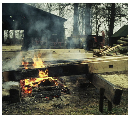
Trykimprægning bruges især til træstolper, der skal graves ned i jorden. Giftstofferne begrænser de trænedbrydende råd- og svampe-mekanismer. Men giftstofferne vaskes derved også ned i jorden. En gammel 'imprægneringsmetode', der ikke forurener jorden er at kulsværte bjælkernes ender. Råd og svamp går kun meget langsomt gennem trækulsaget, så de jordgravede stolper erfaringsmæssigt kan stå i 90-100 år.

Organiske opløsningsmidler er malermaterialer, der har været "forbudt" indenfor malerfaget siden 1982, undtagen under særlige beskyttelsesforanstaltninger.