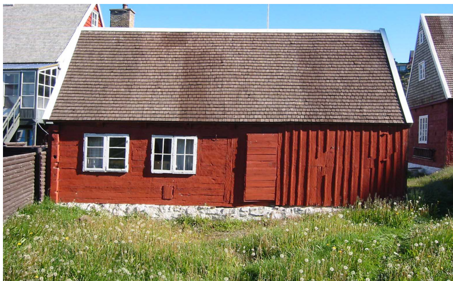
De bevaringsmæssige og kulturhistoriske forhold ved den bygning, der skal males, bør spille ind i valget af maleprodukter – og farver – sammen med de tekniske og æstetiske/arkitektoniske forhold, hvortil kommer praktiske og økonomiske. Dette hvalfangerhus i Grønland har i 230 år været malet med hvalolie iblandet engelskrødt pigment og harpiks, hvad der har bevaret huset godt, så det ville være en dødsynd, hvis man begyndte at male det med plasticmaling i dag.