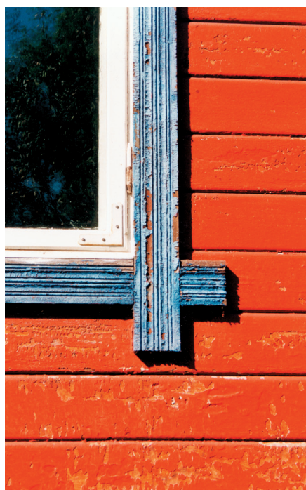
Linoliemaling, som dette informationsblad vil handle en del om, er tydeligt at kende fra andre malingsstyper som plasticmaling og alkydmaling – ved sin karakteristiske 'slangeskindskrakelering', der kommer, når den bliver ca. 10 år gammel.

De to vigtigste faktorer ved træets biologiske nedbrydning er ilt og vand.