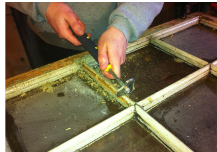
Vådafskrabning, uden varme. Linolien blødgør og løsner de gamle, løse malingslag. Herefter skrubes der med en hårdmetalskraber.