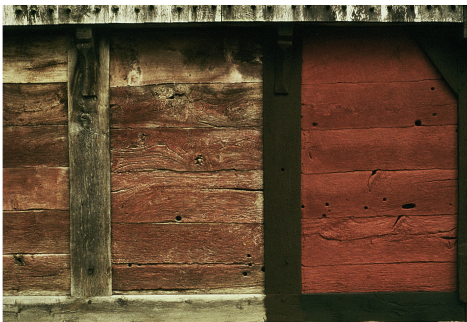
Svensk bulhus med det yderste fag nymalet med 'svensk slamfarve' i henholdsvis rød og sort farve.

skudsmål i forhold til dens træbevarende effekt. Malingen fremstilles af kogt rugmel, hvori der blandes jernvitriol, som virker konserverende samt mug- og skimmelhindrende samt pigmenter i den farve man ønsker sig – ofte den karakteristiske, svenskrøde nuance. Den relativt svage maling lukker aldrig vand og fugt inde i træet, den har en utrolig smuk, kalkagtig lysreflektion og ændrer ikke sin klare farve med tiden.