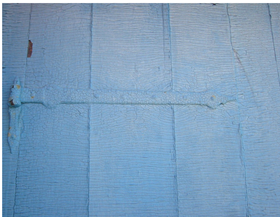
Slangeskinds-krakeleret linoliemaling på en revedør fra 1777.

På udvendigt træ vil linoliemaling ikke skalle af, men i stedet nedbrydes