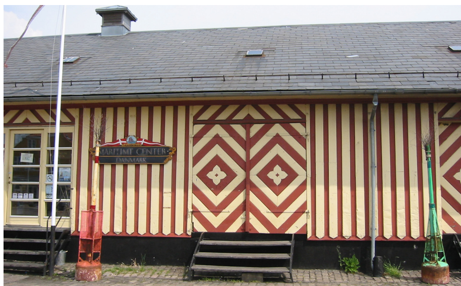
Et kraftigt udhæng, en høj sokkel, et vandbræt for nedden på beklædningen – det er de tre grundregler for 'konstruktiv træbeskyttelse' – her oven i købet med brædder, der har tilspidsede ender, så vandet løber godt af.

Som det ses, går den naturlige træbevaringsmetode for udvendigt træ ud på at holde vand og sollys ude fra træet. Denne metode kan stadig anvendes med lige så stor og effektiv virkning som for 800, 200 eller 50 år siden. Hvis man holder træet så tørt som muligt, så længe som muligt og