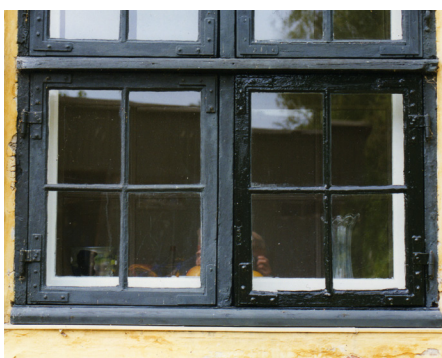
Bindingsværk overfladebehandlet med den kulsorte stenkulstjære. Tjæren er meget tæt og 'stenagtig' og egner sig ikke til udvendigt eller indvendigt træ – og heller ikke til sokler.