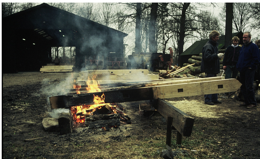
Bindingsværk overfladebehandlet med den kulsorte stenkulstjære. Tjæren er meget tæt og 'stenagtig' og egner sig ikke til udvendigt eller indvendigt træ – og heller ikke til sokler.

Hvis det imprægnerede træ bearbejdes, f.eks. ved at der saves, bores, sømmes eller skrues i det, skaber man et