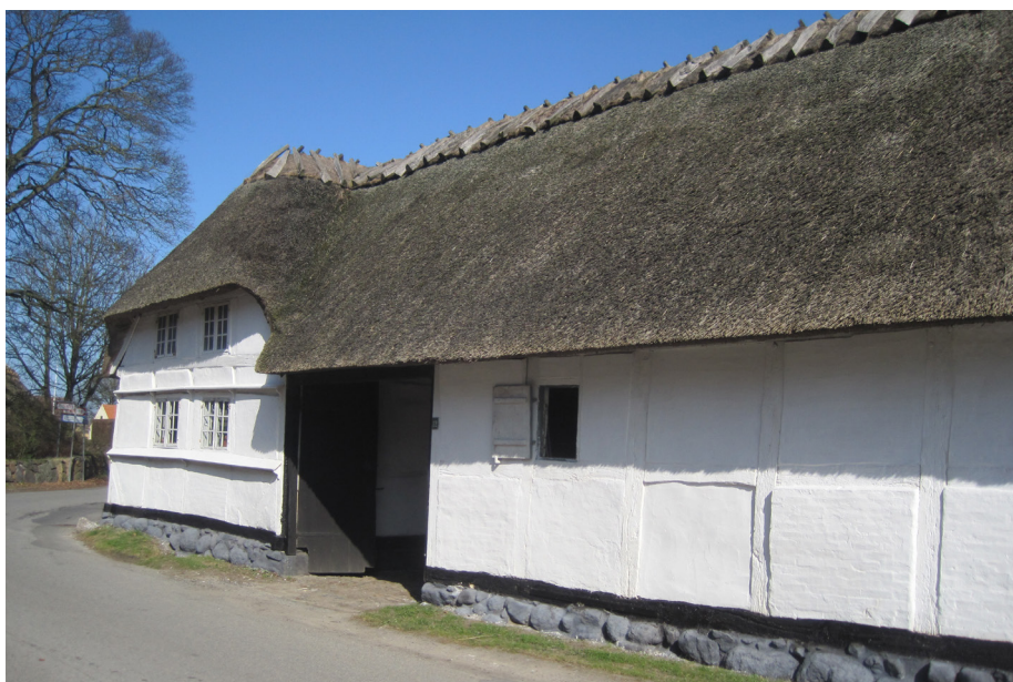
På overkalket tømmer på bindingsværk, enten i hvidt som her, eller som rødt eller gult, skal man ændre kalkens kemiske binding til en limfarve. Det gøres ved at blande kasein (tørkasein eller uhomogeniseret kærnemælk) i kalken. Her gælder dette også de skrånede vandbrædder på gavlen, hvor kalk uden limfarve ikke har nogen binding og hurtigt regner af. Da pigmenterne er mineralske kan man efterfølgende kalke henover det limfarvede træ.

I øvrigt kræver de erklærede miljøvenlige, vandige plast- og akrylmalinger temmelig krasse og miljø- og arbejds-miljøbelastende stoffer som en helt nødvendig bundbehandling på udvendigt træ, hvad der gør den samlede behandling knap så miljøvenlig.