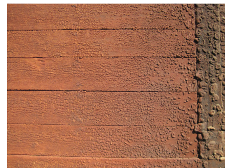
Engelskrød trætjærefarve. Ud over at holde ekstremt godt patinerer denne maling/farve utroligt smukt. Den er derfor velegnet til 'grovere' træbygninger, porte, luger og tagspån. Men ikke til eksempelvis yderdøre, vinduer eller en bänk.