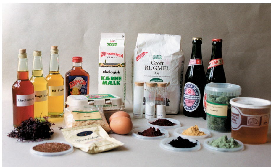
Nogle af ingredienserne til de traditionelle malingsstyper til udvendigt træ: linolie, uhomogeniseret kærnemælk, groft rugmel, øl, jernvitriol, æg og bivoks.