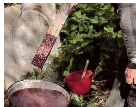
Kogning af 'svensk slamfarve'. Vandet koger og der hældes jernvitriol i. Når vandet koger tilsættes rugmel, hvorefter blandingen koger et kvarter under konstant omrøring. Herefter tilsættes pigmentet, i dette tilfælde rødt, men det kan også være gult, grønt, sort eller brunt.