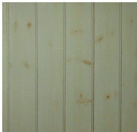
Ved maling med linolie-maling (og i øvrigt også plasticmaling og alkydmaling) på helt nyt træ er det meget vigtigt, at man forsegler alle knaster med shellak. Ellers vil knasterne i løbet af nogen tid 'svede' ud gennem malingen.

Grunden til at der anbefales linolie-maling til ny og genmaling af vinduerne er, at denne maling har den bedste vedhæftning af alle malinger, herunder også på gamle malingslag. Derudover trænger selve linolien godt ind i træet og holder derved vand og fugt ude.