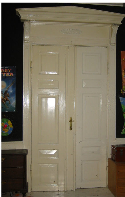
Blanklakeret dør fra ca. 1800, formentlig med hvid lakfarve.

indvendigt træværk, herunder gulvene, op gennem 1800-tallet. Jo mere skinnende, jo bedre. Efterhånden fortrængtes limfarverne helt til de pudsede vægflader, og olie- og lakfarverne blev enerådende på alt træværk.