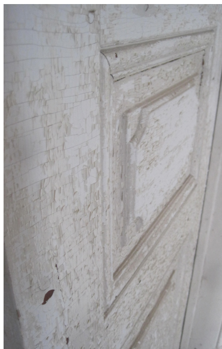
Kraftigt afskallet maling på en fyldingsdør. Under den afskallede maling ses en krakeleret, men nogenlunde intakt linoliemaling, så behandlingen kan bestå i at slibe og skrabe den afskallede maling af manuelt ved en vådafskræbning/slibning med linolie og herefter nymale med blank eller mat linoliemaling.

Linoliemaling vil ofte afsløre sig gennem den karakteristiske "slangeskindskrakelering", der opstår når malingen er 10-15 år gammel. Er malingslaget yngre, og krakeleringen ikke indtrådt endnu, kan man brække et lille stykke maling af og brænde dette med en tændstik. Kommer der en lugt af