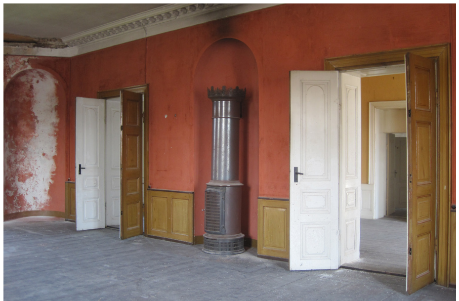
Historicistisk interiør med ådrede paneler og dør