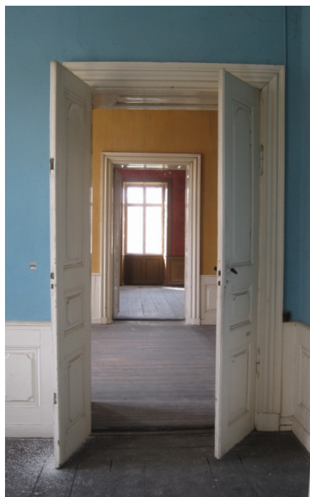
Interiør fra 1750 med brystningspaneler med dobbeltspejl-fyldinger, fyldingsdøre, ligeledes med dobbeltspejl samt kraftigt profilerede indfatninger.

Da det ikke lod sig gøre at omplante det kinesiske laktræ til Europa, måtte man klare sig med forskellige erstatninger. 1700-tallets blanke lakker blev derfor fremstillet af plantesaften/