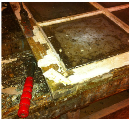
Ved afskrabningen skal man være meget forsigtig med ikke at skramme eller skæmme eventuelle profileringer i vinduer, døre, indfatninger, paneler m.v.