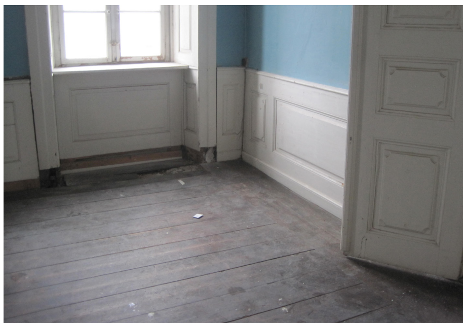
Maling af husets indvendige træværk kan – som det ses her – omfatte døre, dørindfatninger, brystningspaneler, fodpaneler samt i baggrunden pillepaneler og lysningspaneler mm.

Det skal derfor som noget helt naturligt også anbefales at lade malerarbejdet på husets indvendige træværk udføres af en faguddannet maler med dokumenteret erfaring med tradi-