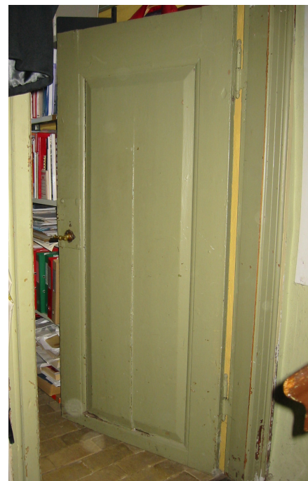
Barokdør med stor fyldning. Fyldningen er revnet i midten og døren er desuden kraftigt afkörtet i underkanten, formentlig fordi gulvet på et tidspunkt er hævet.

Plast- eller akrylmaling vil ligne alkydmalingen meget i overfladen og i måden at boble op og skalle af på. Plasten afslører sig ved afbrænding af et lille stykke maling. Dette vil brænde og lugte som plastik.