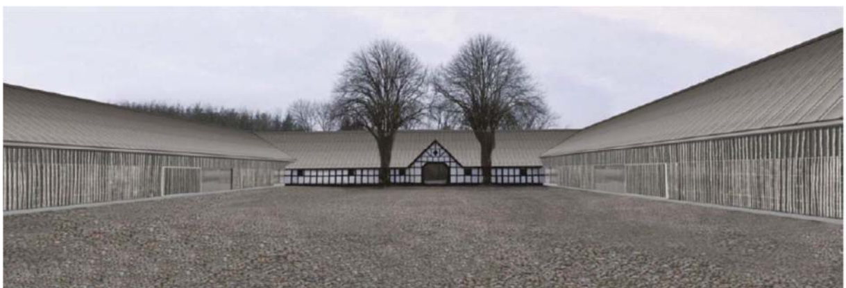
Ullerup: Addition, indpasset nybyggeri