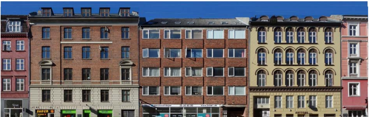
Sankt Hans Torv i København. Engang, her i 1930-erne, kunne arkitekterne godt tilpasse huse fra forskellige tidsaldre til en harmonisk helhed.

Særligt på herregårdene er det vigtigt, at nye arkitektoniske tilføjelser præciserer og udvider karakteren af stedet og tilstræber kontinuitet og helhed.