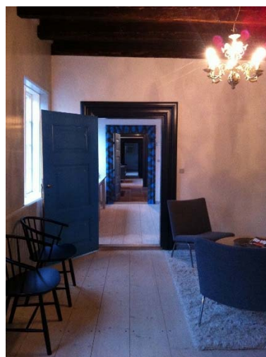
Gl Broløke: restaurering og rekonstruktion