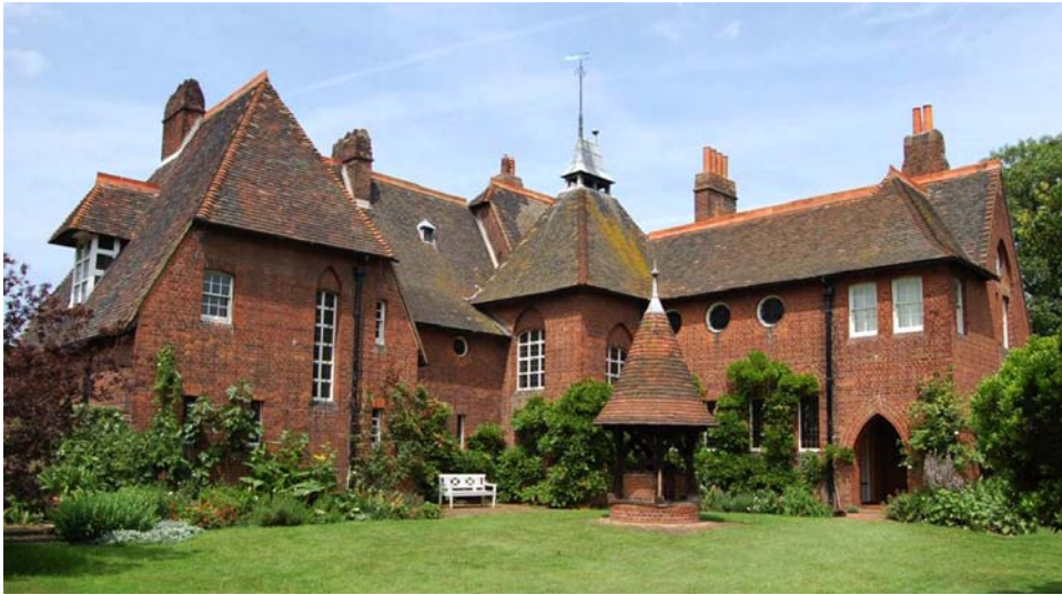
William Morris' eget hus 'The Red House' var med til at lægge grunden for 'The Arts and Crafts Movement'

Trods sin rent britiske base har disse tre initiativer i høj grad inspireret til lignende initiativer i resten af Europa og USA. I Danmark er 'Landsforeningen Bedre Byggeskik' f.eks. kraftigt inspireret af 'the Arts and Crafts Movement' og 'Foreningen til Gamle Bygningers Bevaring' er en direkte oversættelse af SPAB til dansk og Realdania Byg er helt klart en dansk pendant til National Trust i England.