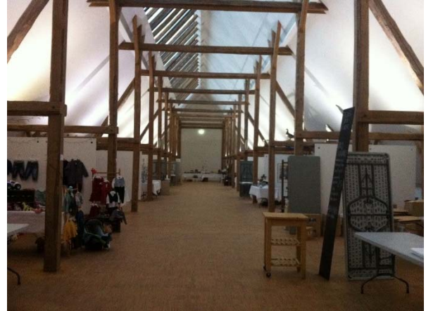
Lundsgård: Transformation af trempellade