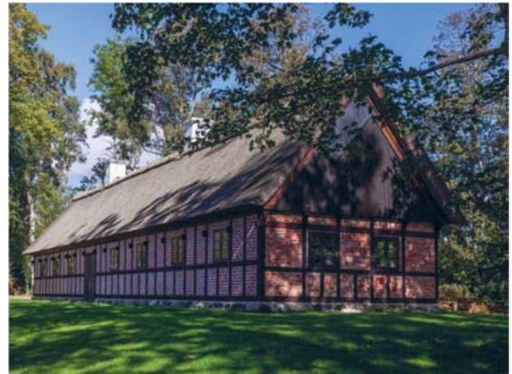
Voergård: Rekonstruktion og transformation